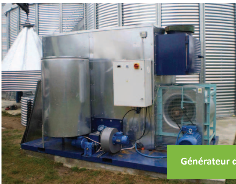
Générateur d'air chaud

Les deux fermes pilotes en place sèchent leur maïs au bois depuis 2008 et 2009. Des adaptations et améliorations ont été apportées suites aux incidents rencontrés et de nombreux enseignements ont été tirés de l'expérience de ces trois campagnes, permettant d'orienter les choix des agriculteurs.